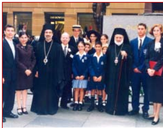
Ἀπὸ τὸν ἑορτασμό τῆς Ἐθνικῆς Ἐπετείου τῆς 25ης Μαρτίου, τῆς Διακοινοτικῆς Ἐπιτροπῆς Ν.Ν.Ο. τῆς Ἱερᾶς Ἀρχιεπισκοπῆς, στὸ Martin Place (Σύδνεϋ 23-3-03).