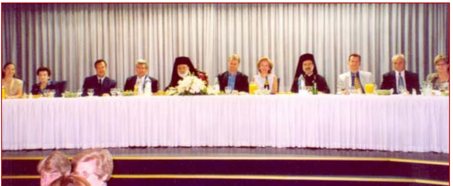
Ἀπό τό επίσημο ἐτήσιο γεῦμα τοῦ Συμβουλίου τῆς Κεντρικῆς Φιλοπτώχου Ἀδελφότητος Ν.Ν.Ο. (Σύδνεϋ 11-2-03).

Ὁρθοδόξου Ἐκκλησίας, θά πρέπει νά σημειώσουμε ὅτι ἐδῶ δέν εἶναι ἀπλῶς μιά εὐλαβῆς ἐφαρμογή τοῦ « ἀδιαλείπτως προσεύχεσθε » (Α' Θεσ. 5,17). Εἶναι κάτι πολύ βαθύτερο. Εἶναι ἡ πειστικώτερη «ὁμολογία» εἰς τό Χαλκηδόνιο δόγμα (τοῦ « ἀχωρίστως » καί « ἀδιαιρέτως », μαζί μέ τό « ἀτρέπτως » καί « ἀσυγχύτως ») τῆς συνεχιζομένης Θεανδρικότητος στήν ζωή τῆς Ἐκκλησίας, ὅπως ἀκριβῶς τήν προδιέγραψε τό ὄνομα «EMMANOYHΛ» τοῦ σαρκωθέντος Κυρίου.