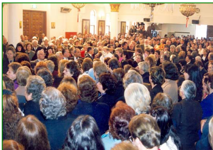
Στιγμιότυπα από τά εγκαινία του Ήρου Ναού Άγ. Παρασκευής St. Alban's Βικτωρίας, τελεσθέντα υπό του Σεβασμιωτάτου Άρχιεπισκόπου Αύστραλίας κ.κ. Στυλιανού (28-9-03).