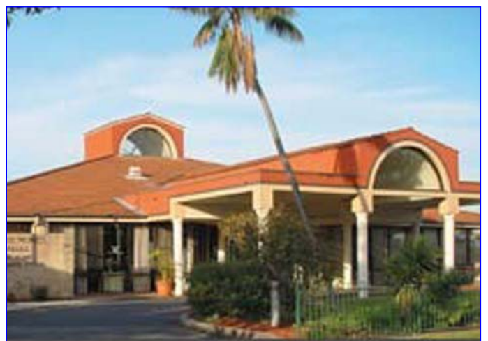
St. Basil's Homes Sydney.