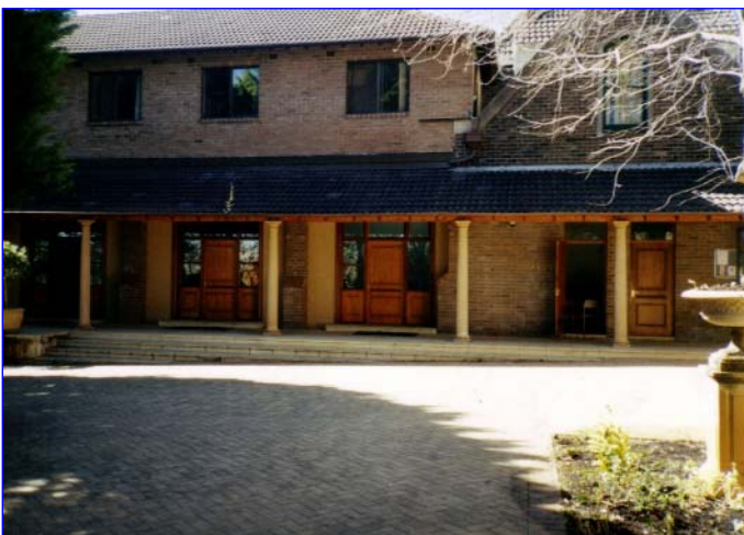
St. Andrew's Theological College.