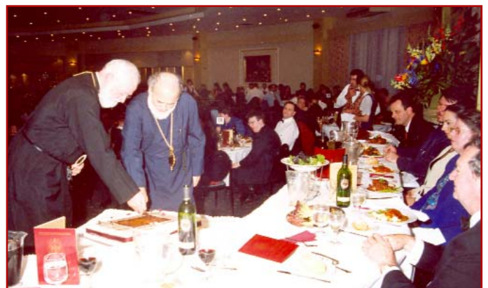
‘Ο Σεβασμιώτατος Ἀρχιεπίσκοπος μας κ.κ. Στυλιανός κόβει τὴν Τούρτα κατὰ τὸ ἐπίσημον δεῖπνον (Gala Ball) εἰς τὸ Ultima on Keilor Reception Centre διὰ τὴν 20ὴν ἐπέτειον ἀπὸ τῆς ὀργανώσεως τῆς Νεολαίας μας εἰς Μελβούρνην (28-9-03).

When the body of this venerated saint was exhumed, the world witnessed a miracle. His body was in a state of perfect preservation, as were his priestly robes. In addition to that there exuded from his casket an aroma like that of perfume. From all over Europe and the Middle East people made their way to look upon this holy man who lay there as though asleep. Encased in a glass casket at the nunnery on his beloved island, he lies in state to this day and is looked upon with sublime reverence by thousands of visitors each year.