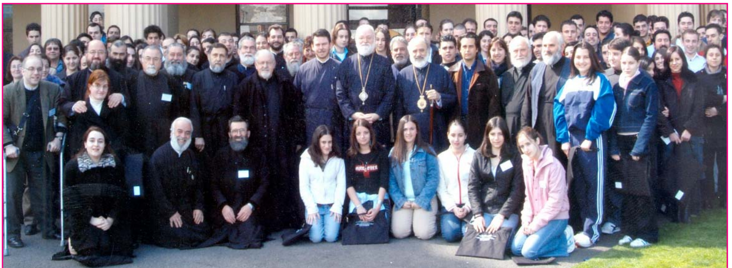
Στιγμιότυπα ἀπὸ τὸ 8 ο Πολιτικὸ Συνέδριο Νεολαίας στὴν Βικτώρια. Ἄνω: Ἀπὸ τὴν τελετὴν Ἐνάρξεως τοῦ Συνεδρίου εἰς τὸν Ἱερόν Ναόν τοῦ Ἁγίου Εὐσταθίου South Melbourne. Εἰς τὸ μέσον: Ὁ Σεβασμιώτατος Ἀρχιεπίσκοπος κ.κ. Στυλιανός καὶ ὁ Θεοφ. Ἐπίσκοπος Δέρβης κ. Ἰεζεκιήλ μετὰ τοῦ Ἀρχιδικαστοῦ τῆς Βικτωρίας κ. John H. Phillips μετὰ τῆς συζύγου του, ὁ ὁποῖος ἐκήρυξε τὴν ἐπίσημον ἑναρξιν τῶν ἐργασιῶν τοῦ Συνεδρίου. Κάτω: Ἀναμνηστικὴ φωτογραφία τῶν Συνεδρῶν (28-9-03).

κοῦ μαθήματος στὰ Δημόσια Σχολεῖα (2-9-03).