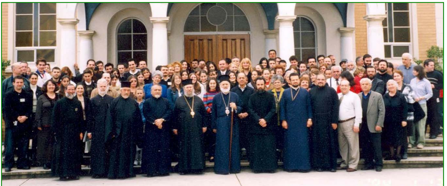
Ἀναμνηστικὴ φωτογραφία τῶν Συνέδρων τοῦ 8οῦ Πολιτειακοῦ Συνεδρίου Νεολαίας στήν Νότιο Αὐστραλία μετὰ τοῦ Σεβασμιωτάτου Ἀρχιεπισκόπου μας κ.κ. Στυλιανού, τοῦ Θεοφ. Ἐπισκόπου Δορυλαίου κ. Νικάνδρου καί τῶν Κληρικῶν (Ἀδελφίδα 3/4-10-03).

–Ἐχοροστάτησε καί ἐκήρυξε εἰς τόν Ἱερό Ναόν Ὑπα-