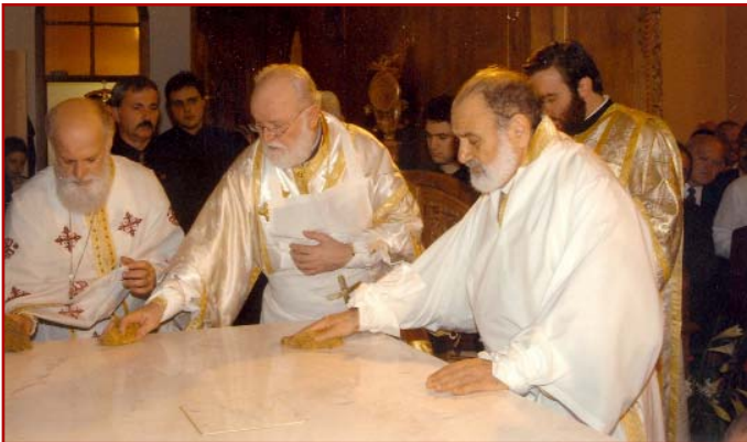
Στιγμιότυπα από τά έγκαινία του Ίερού Ναού Ύπαπαντής του Κυρίου Coburg (Βικτώρια 19-10-03).