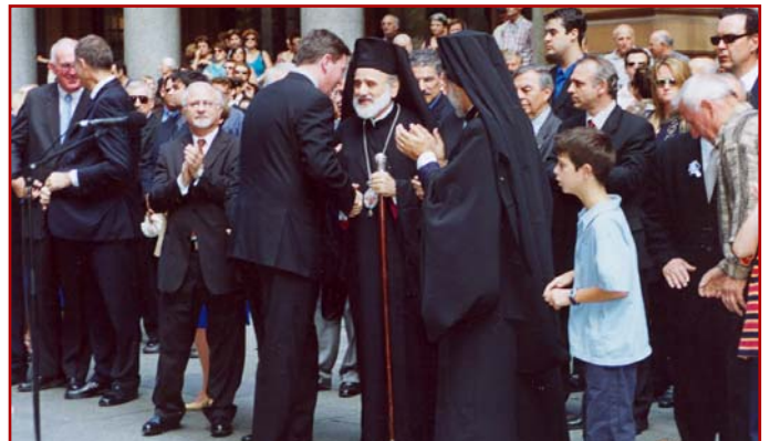
Στιγμιότυπα από τις Έορταστικές εκδηλώσεις επί τη έπετειώ της Έθνικής μας Παλιγγενεσίας. Η είθισμένη Δοξολογία χοροστατούντος του Σεβ. Αρχιεπισκόπου μας κ.κ. Στυλιανού εις τόν Καθεδρικό Ναόν του Ευαγγελισμού Redfern, παρουσία των Προξενικών, Πολιτικών και Διακοινοτικών Αρχών, ή έπιμνημόσυνης δέησης και ή κατάθεση στεφάνων στό Martin Place (27-3-04).

cannot survive if decision-makers on the international scene today prefer to support economic and strategic growth and consumerism , rather than ethical , cultural and spiritual development.