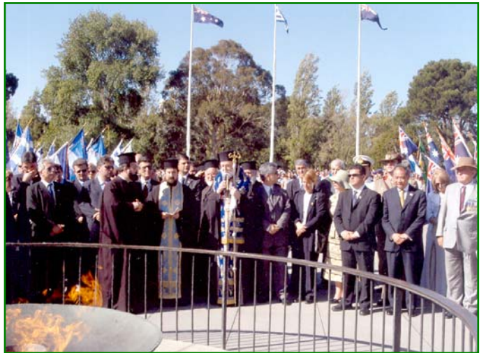
Στιγμιότυπον από τό Τρισάγιον εις τό μνημειον του Άγνώστου Στρατιώτου κατά τήν Έθνικήν μας Έορτήν 25ης Μαρτίου εις Μελβούρνην (28-3-04).