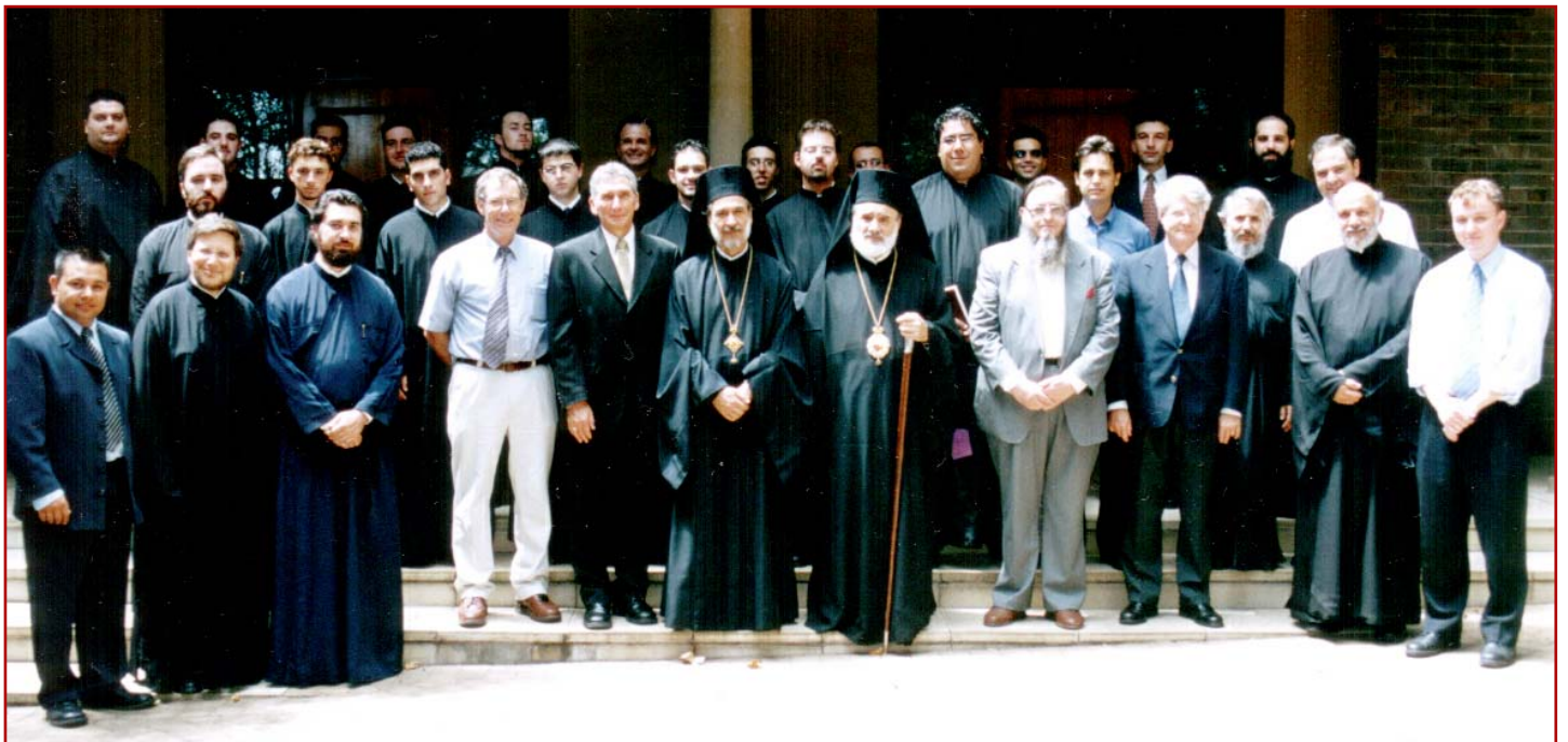
Ἀναμνηστική φωτογραφία τοῦ Σεβασμιωτάτου Ἀρχιεπισκόπου Αὐστραλίας κ.κ. Στυλιανοῦ, Κοσμητῶρος τῆς Θεολογικῆς Σχολῆς τοῦ Ἀποστόλου Ἀνδρέου, μεθ' ὅλων τῶν Διδασκόντων καί Διδασκομένων ἐν αὐτῇ, ἐπ' εὐκαιρίᾳ τῆς ἐνάργεως τοῦ Νέου Ἀκαδημαϊκοῦ Ἔτους 2004.

With fervent prayers in the Risen Christ Archbishop S T Y L I A N O S