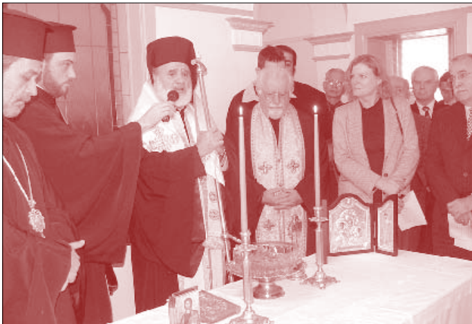
Στιγμιότυπον ἀπό τόν Ἁγιασμό πού ἐτέλεσε ὁ Σεβασμιώτατος Ἀρχιεπίσκοπος μας κ.κ. Στυλιανός εἰς τό νέο παράρτημα τοῦ Ἑλληνικοῦ Κέντρου Προνοίας ΝΝΟ στό πρόαστειο Parramatta (4-7-06).

–Ἐδέχθη τόν ἐκ Χανίων Κρήτης π. Κ. Κνιθάκη, ἐλθόντα ἐκ νέου