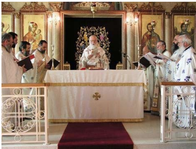
Στιγμιότυπον ἀπὸ τὴν Θ. Λειτουργία τοῦ Ἁγίου Ἰακώβου τοῦ Ἀδελφοθέου εἰς τόν Ἱ. Ναόν Ἁγ. Εὐσταθίου (23-10-06).

Παρέστη εἰς πῆν χοροεσπερίδα τῶν τελειοφοίτων τοῦ Κολλεγίου τοῦ Ἁγίου Ἰωάννου εἰς τό χῶλλ τοῦ Ἁγίου Χαραλάμπους Templestowe. Εὐλόγησε πῆν Τράπεζα, ὠμίλησε καταλλήλως,