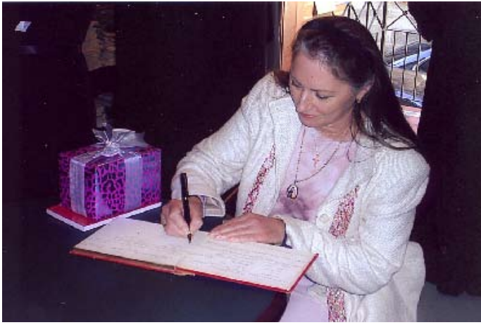
Ἡ ἐκ Βελιγραδίου Πριγκήπισσα Linda Karadjorgevic, μέλος τῆς Πατριαρχικῆς ἀποστολῆς διὰ τὴν ἐνθρόνισιν τοῦ νέου Σέρβου Ἐπισκόπου Αὐστραλίας καὶ Ν. Ζηλανδίας κ. Εἰρηναίου, ὑπογράφουσα τὸ βιβλίον ἐπισκεπτῶν τῆς Θεολογικῆς μας Σχολῆς τοῦ Ἀποστόλου Ἀνδρέου (21-10-06).

τόν μαθητὴ Λυκείου υἱόν του Μιχάλη, τοὺς ὁποίους καὶ ἐκράτησε εἰς Γεῦμα (13-10-06).