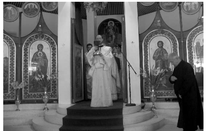
Στιγμιότυπα ἀπὸ τὴν εἰς Διάκονον χειροτονίαν ὑπὸ τοῦ Σεβασμιωτάτου Ἀρχιεπισκόπου μας τοῦ ἐκ τῶν ἀποφοίτων τῆς Θεολογικῆς μας Σχολῆς Nicholas Brown, εἰς τὸν Ἱ. Ναόν τῆς Παναγίας ἐν Mt Gravatt (15-10-06).