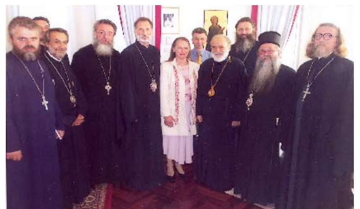
Στιγμιότυπα ἀπό τή ἐπίσκεψιν εἰς τὰ Κεντρικά Γραφεῖα τῆς Ἱερᾶς Αρχιεπισκοπῆς μας τοῦ νέου Ἐπισκόπου τῆς Σερβικῆς Ἐκκλησίας στήν Αὐστραλία κ. Εἰρηναίου συνοδευομένου ὑπό τῶν Σέρβων Ἐπισκόπων, καί τῆς Σερβίδος Πριγκηπισσῆς Linda Karadjorgjevic, μετά τῶν ὁποίων ὁ Σεβασμιώτατος Αρχιεπίσκοπός μας εἶχεν δίωρον οὐσιαστική συνομιλία (24-10-06).