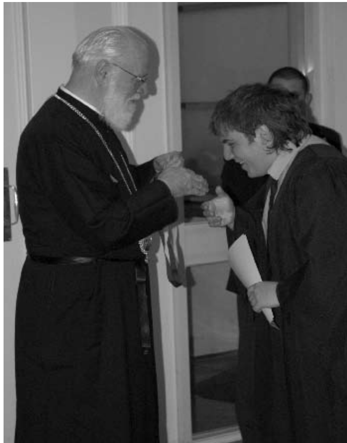
Ὁ Θεοφιλέτατος Ἐπίσκοπος Δέρβης κ. Ἰεζεκιήλ ἀπονέμοντας τὰ βραβεῖα εἰς τούς τελειοφοίτους τοῦ Κολλεγίου τοῦ Ἁγίου Ἰωάννου (23-10-06).

τούς ἠυχθή καλὴ ἐπιτυχία εἰς τὰς ἐξετάσεις καί διεβίβασε πρὸς αὐτούς τὰς εὐχὰς καί εὐλογίας τοῦ Σεβασμιωτάτου Ἀρχιεπισκόπου (23-10-06).