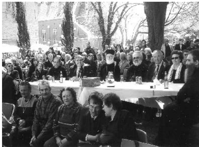
Ἀπὸ τῆ πανηγυρικῆν ἐκδήλωσιν εἰς πῆν Ἱ. Μονὴν τοῦ ΑἰῶΝ ΕΣΤΙΝ ἐπὶ τῆ Ἑθνικῆ Ἐπετείῳ τῆς 28 ης Ὀκτωβρίου (29-10-06).

Ἀκολούθησε γεῦμα εἰς τό χῶλ τοῦ Ἱ.Ν. διὰ τούς ἐπισήμους, ἐν συνεχείᾳ μετὰ τοῦ διακόνου Μανασσῆ μετέβη εἰς πῆν Ἱ. Μονὴν