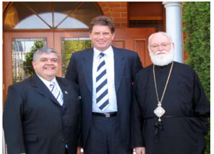
Ἀναμνηστικὴ φωτογραφία ἀπὸ τὴν ἐπίσκεψιν εἰς τὰ Γραφεῖα τῆς Ἱερᾶς Ἀρχιεπισκοπῆς ἐν Μελβούρνην τοῦ ἀρχηγοῦ τῆς ἀντιπολιτεύσεως τῆς Βικτωρίας κ. Ted Baillieu MLA (18-10-06)

Ἐν συνεχείᾳ ἐπεσκέφθησαν τήν Βασιλειάδα καί εἶδον τὰς