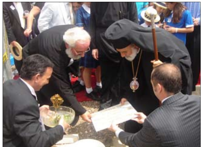
Στιγμιότυπα ἀπό τόν Ἀγιασμόν καί τήν κατάθεση τοῦ Θεμελίου λίθου τοῦ νέου κτηριακοῦ συγκροτήματος τοῦ Διγλώσσου Κολλεγίου τῶν Ἁγίων Πάντων (Σύδνεϋ 28-10-07).