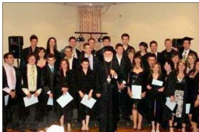
Ἀπό τήν χοροεσπερίδα τῶν τελειοφίτων τοῦ Κολλεγίου τοῦ Ἁγίου Ἰωάννου Preston εἰς τό Ultima Reception Keilor Μεμβούρνη (22-10-07).