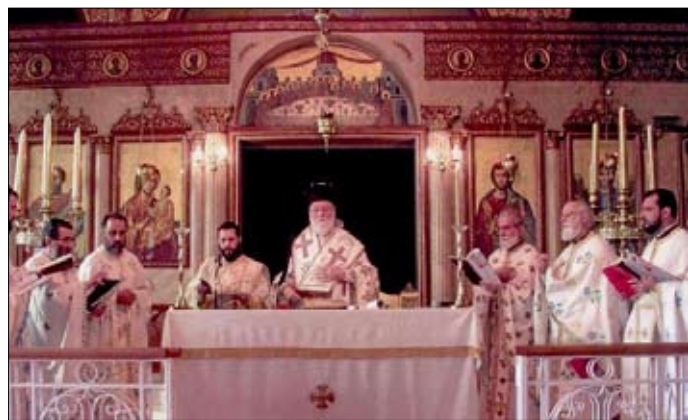
Ἀπό τόν Θεῖαν Λειτουργίαν τοῦ Ἁγίου Ἰακώβου τοῦ Ἀδελφοθέου εἰς τόν Ἱ. Ναόν τοῦ Ἁγίου Εὐσταθίου South Melbourne (23-10-07).

–Ελειτούργησε καί ἐκήρυξεν εἰς τήν Ἱ. Μονήν τοῦ ΑΞΙΟΝ ΕΣΤΙΝ Northcote καί ἐτέλεσε τήν Δοξολογίαν ἐπί τῇ ἐπετείῳ τῆς Ἑθνικῆς Ἑορτῆς τῆς 28 ης Ὀκτωβρίου, παρουσία πολλῶν ἐπισήμων καί πλήθους πιστῶν. Ἰδιαιτέρως εἰς τήν Δοξολογίαν παρέστησαν ὁ Πρόεδρος καί τὰ μέλη τῆς Ἐνώσεως Ἑνοριῶν καί Κοινοτήτων Μεμβούρνης καί Βικτωρίας. Τήν μεσημβρίαν