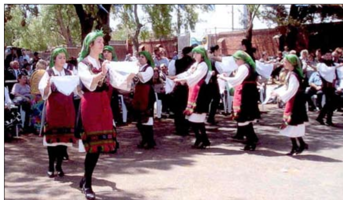
Ἀπό τήν Δοξολογίαν καί τίς ἑορταστικές ἐκδηλώσεις ἐπί τῇ ἐπετείῳ τῆς Ἑθνικῆς Ἑορτῆς τῆς 28 ης Ὀκτωβρίου εἰς τήν Ἱερά Μονή τοῦ ΑΞΙΟΝ ΕΣΤΙΝ Northcote Μεμβούρνη (28-10-07).