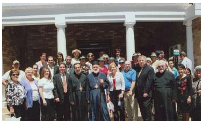
Ὁ Σεβασμιώτατος, συνοδευόμενος ἀπό τόν Θεοφιλ. Ἀπολλωνιάδος, ἐκήρυξε τήν ἑναρξιν τοῦ 31ου Μαραθωνίου (WALK-A-THON) 2007, τό ὅποιον ἐφέτος ἐφιλοξένησε εἰς τοὺς χώρους τῆς ἡ Ἑνορίας - Κοινότητος Ἁγ. Ἰωάννου Parramatta (Σύδνεϋ 4-11-07).