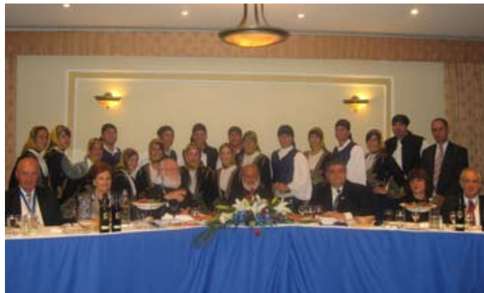
Στιγμιότυπα ἀπό τό Ἐπίσημο Δεῖπνον πρός τιμήν τοῦ ἐορτάζοντος Ποιμενάρχου μας Σεβασμιωτάτου Ἀρχιεπισκόπου κ.κ. Στυλιανοῦ (Μελβούρνη 25-11-07).