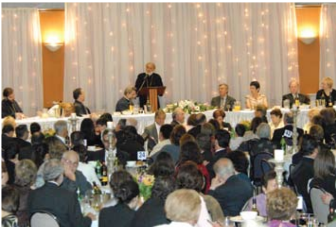
Στιγμιότυπα από τὸ Ἐπίσημο Δείπνον ἐπ' εὐκαιρία τῶν Ὀνομαστηρίων τοῦ Ποιμενάρχου μας Ἀρχιεπισκόπου Αὐστραλίας κ.κ. Στυλιανοῦ εἰς τὴν Αἴθουσα Ἐκδηλώσεων "Palais" (Σύδνεϋ 26-11-07)

ὑπὸ ἀνέγερσιν Ἱ. Κοιμητηριακόν Ναόν τῆς Ἀναστάσεως τοῦ Λαζάρου (8/11/07).