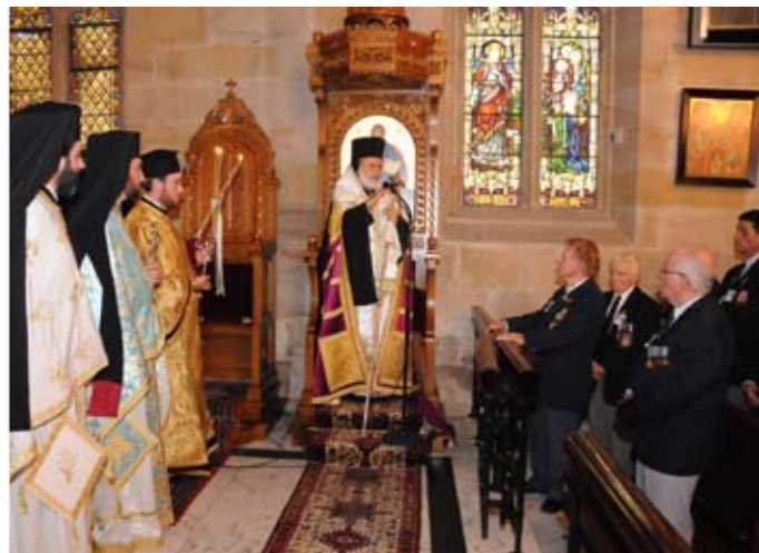
Έπί τη Έθνική Έορτή της 25ης Μαρτίου, εις τον Ί. Καθεδρικόν Ναόν, ό Σεβασμιώτατος Αρχιεπίσκοπος Αυστραλίας κ.κ. Στυλιανός, έτέλεσε τήν καθιερωμένη Δοξολογία εις τήν όποία παρέστησαν τό ζεύγος του Γεν. Προξένου και λοιποί Αξιωματούχοι του Έλληνικού Προξενείου, οί έν Σύδνεϋ Έλληνικές Υπηρεσίες, εκπρόσωποι Ένοριών-Κοινοτήτων, Κολλεγίων, Αδελφοτήτων και φορείς άλλων Παροικιακών Οργανισμών, καθώς και πλήθος πιστών (Σύδνεϋ 16-3-08)

– Παρεχώρησε συνέντευξη στήν κα Rachael Kohn, Διευθύντρια του Ραδιοφωνικού Προγράμματος του ABC, και άπήντησε σε πλήθος έρωτημάτων αυτής ως προς τον κατ' έτος έορτασμό του Πάσχα, καθώς και ως προς τίς διαφορές