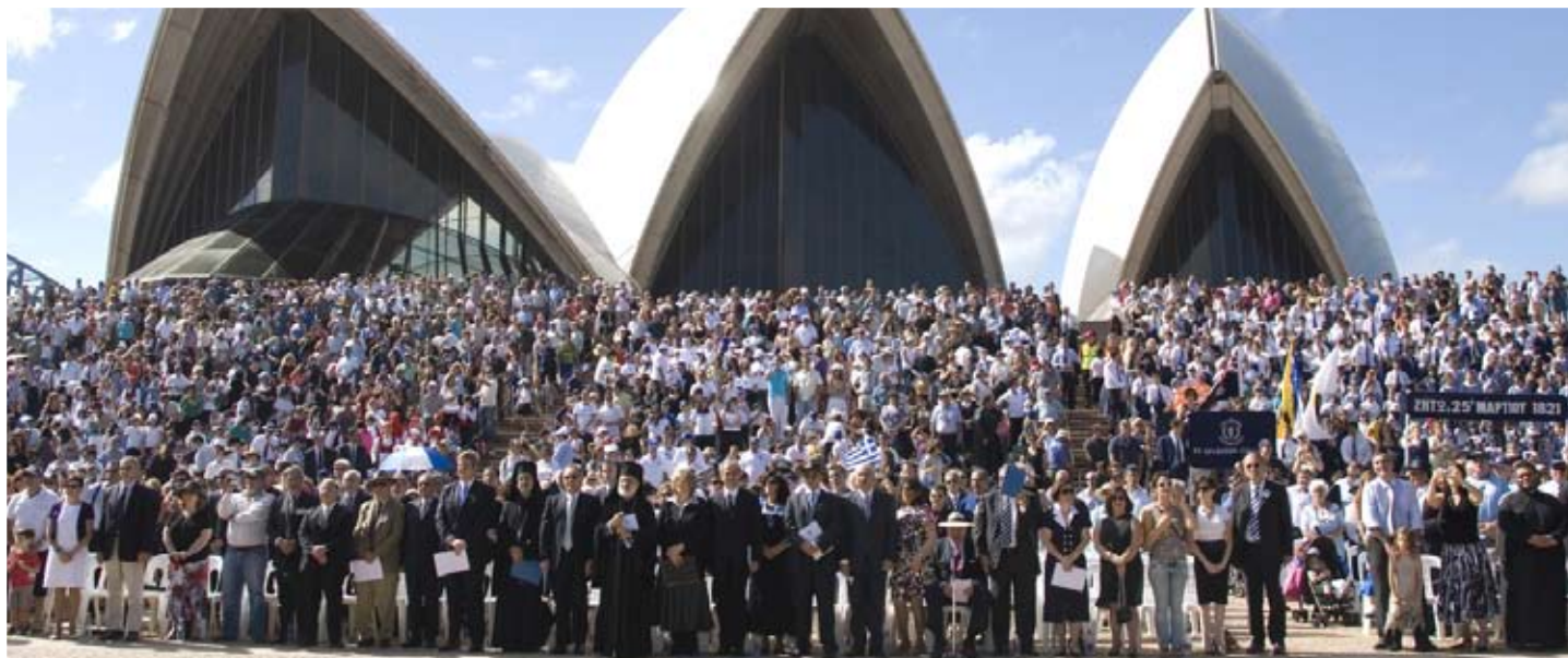
Επί τη Έθνική Έορτή της 25ης Μαρτίου, εις τόν προαύλιον χώρον του Opera House, ενώπιον των Έπισήμων ήτοι του Πολιτειακού Πρωθυπουργού κ. Morris Iemma, του τέως Πρωθυπουργού Αυστραλίας κ. Gough Whitlam και άλλων Πολιτευτών άμφοτέρων τών Κομμάτων (Κυβερνήσεως και Αντιπολιτευσεως), καθώς και πλήθους κόσμου, έπραγματοποιήθη πλούσιον έορταστικό πρόγραμμα μέ σχετικές όμιλίας και έθνικούς χορούς (Σύδνεϋ 16-3-08).

Having said all the above, I congratulate the Organising Committee, for all their efforts to make this year's celebration also a glorious event for all of us, and I ask for your indulgence to say just a few words in Greek as well, in order to keep our bi-lingual tradition.